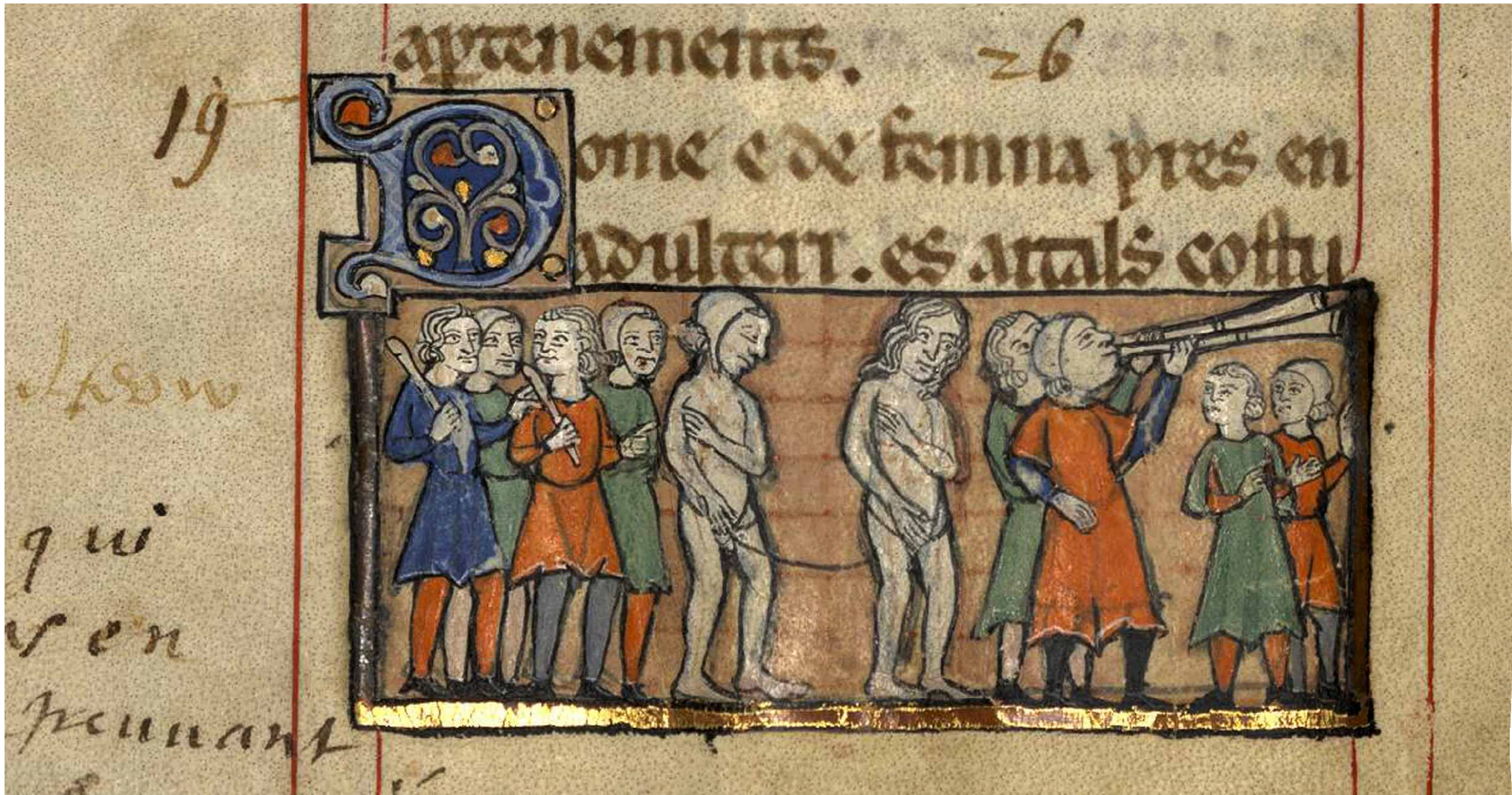
1197 - Livre des Coutumes de la ville d'Agén - Archives Départementales de L.-G.

[23] - Item, adulter et adultera, si deprehensi fuerint in adulterio, si inde fuerit factus clamor vel per homines fide dignos super hoc convicti fuerint, vel confessi in iure, quilibet in centum solidis pro justicia puniatur, vel nudi currant villam; et sit opcio eorumdem.