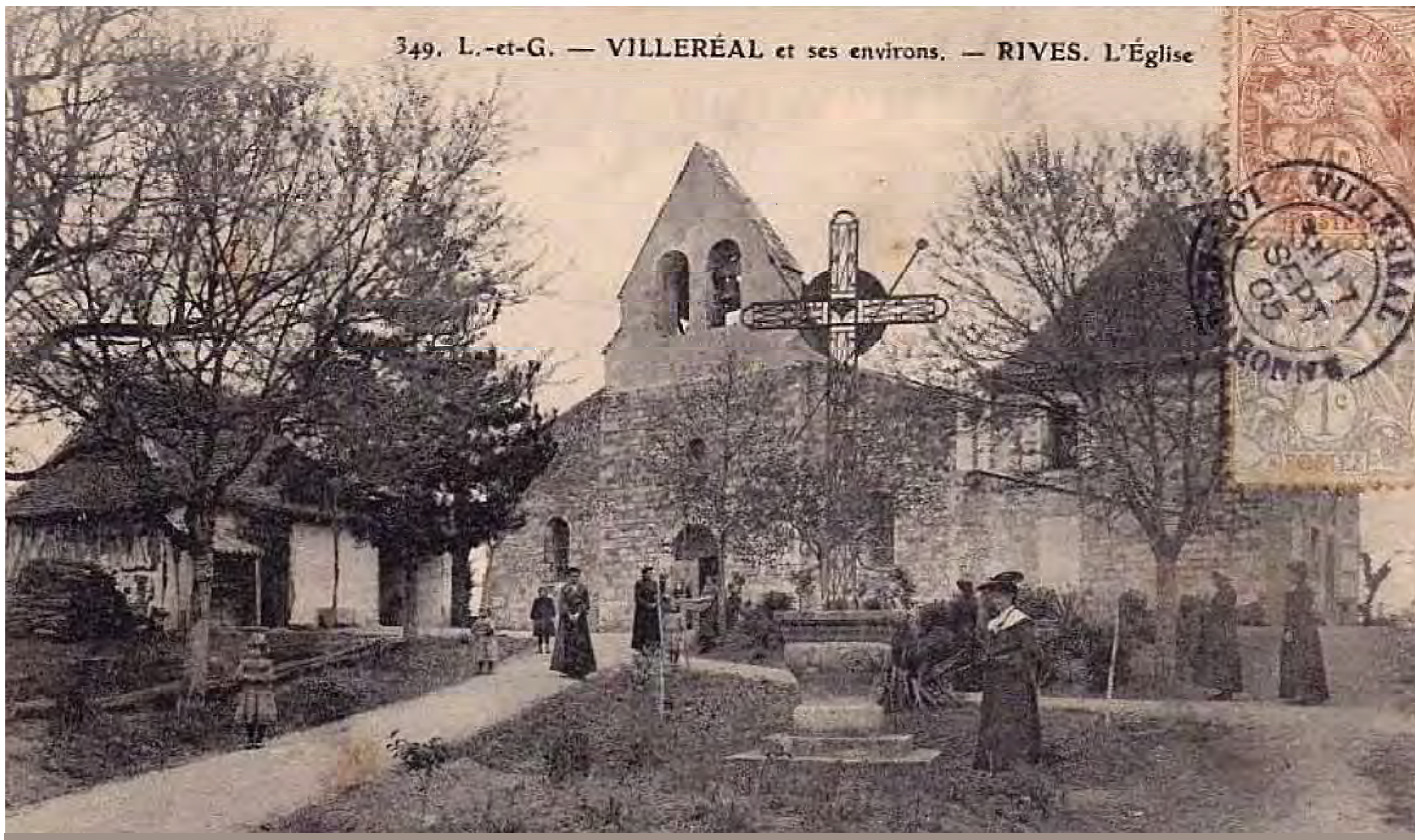
Rives et son prieuré existaient bien avant que Ville Regalis ne soit fondée sur un domaine appartenant à la puissante abbaye d'Aurillac, qui comptait seize diocèses allant de Clermont à Vence (06), Toulouse, Lugo (st Jacques de C.), Angoulême et Limoges. À cela, il fallait ajouter les fiefs issus du comte Géraud et du comte de Toulouse...