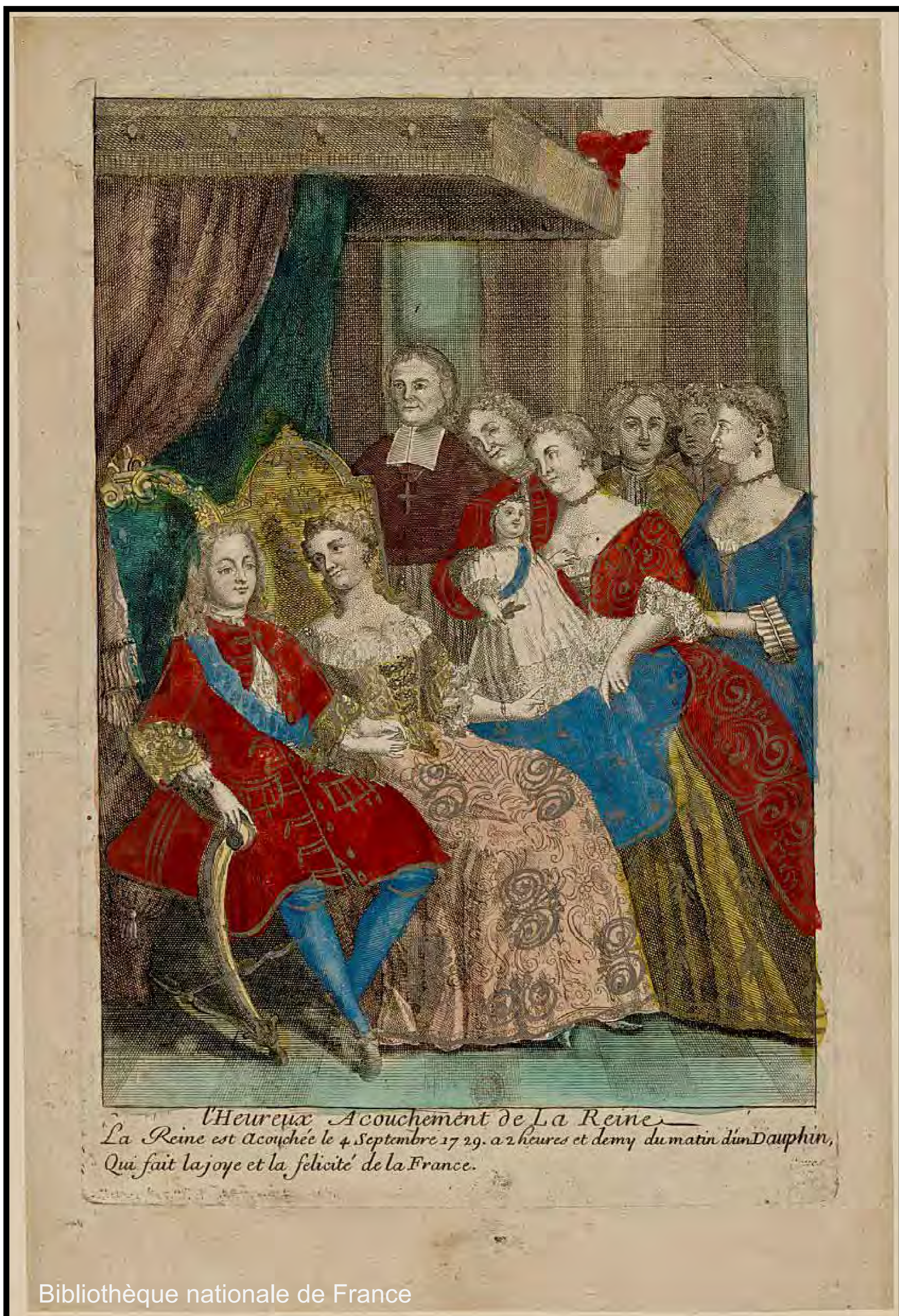
L'heureux Accouchement de La Reine La Reine est accouchée le 4 Septembre 1729, à 2 heures et demy du matin d'un Dauphin, Qui fait la joye et la félicité de la France.