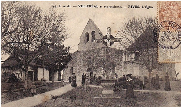
Rives et son prieuré existaient bien avant que Ville Regalis ne soit fondée sur un domaine appartenant à la puissante abbaye d'Aurillac, qui comptait seize diocèses allant de Clermont à Vence (06), Toulouse, Lugo (st Jacques de C.), Angoulême et Limoges. À cela, il fallait ajouter les fiefs issus du comte Géraud et du comte de Toulouse...

*bastida Villeregalis - Villereal, le nom dit bien l'ambition du sénéchal dans une zone frontrière, peu urbanisée et dominée par les seigneurs.