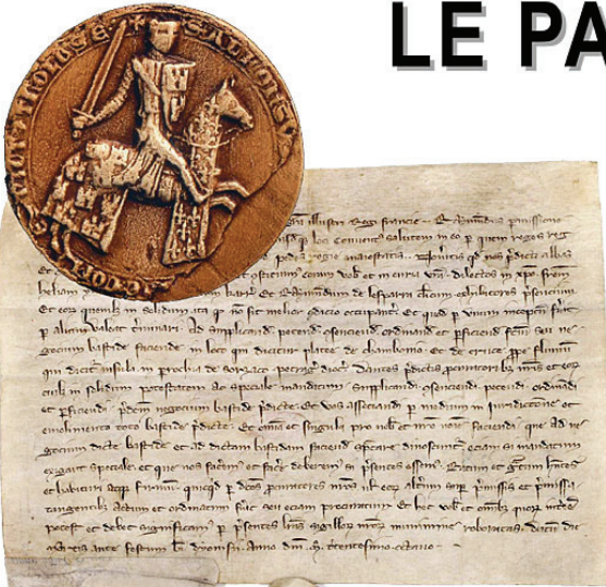
Le parchemin ci-dessus (Arch. Nat.) est un acte de paréage datant d'Alphonse de Poitiers. Le document original fondant la bastide de Villereal reste inconnu

L'histoire de la fondation de la bastide de Villereal – bastida Ville Regalis – débute en 1267 avec les signatures et les cachets scellant l'acte de paréage.