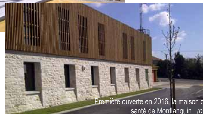
Première ouverte en 2016, la maison de santé de Monflanquin. (DR)