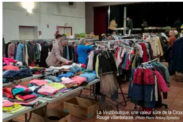
La Vestiboutique, une valeur sûre de la Croix Rouge villeréalaise.

Comme chaque année, l'assemblée générale de l'association du Devoir de mémoire du pays villeréalais a fait le bilan des actions menées dans