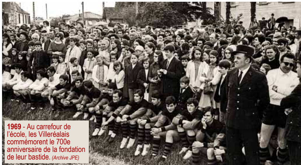
1969 - Au carrefour de l'école, les Villeréalais commémorent le 700e anniversaire de la fondation de leur bastide.

existence était consacrée. Première manifestation de ce 750e anniversaire, l'exposition salle Jean-Moulin a reçu plus de 300 visiteurs. Beaucoup d'autres ont regretté de l'avoir manquée. Une nouvelle exposition – nouveaux documents, nouvelles découvertes – aura lieu en septembre 2018. Vous aussi, vous pouvez y apporter votre contribution. ■