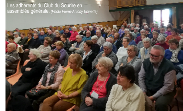
Les adhérents du Club du Sourire en assemblée générale.