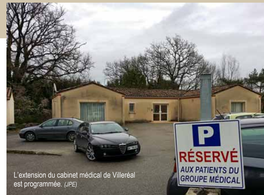
L'extension du cabinet médical de Villeréal est programmée.

quence que le projet de construction d'un troisième bâtiment n'était pas alors une urgence. Le temps passant, l'urgence est maintenant là : depuis trois ans, pour des raisons de santé, la dentiste installée à Villeréal a cessé d'exercer. Elle a finalement fermé son cabinet l'an dernier.