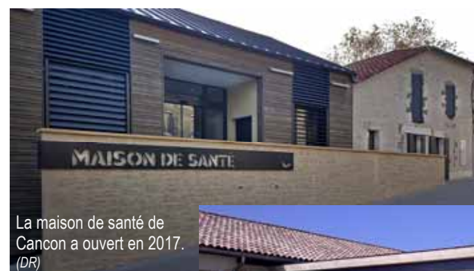
La maison de santé de Cancon a ouvert en 2017.

670 km 2 de superficie 43 communes 17 600 habitants