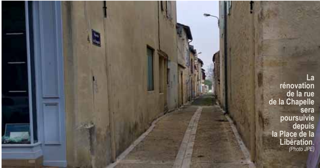
La rénovation de la rue de la Chapelle sera poursuivie depuis la Place de la Libération.

Deux autres demandes de subvention ont été déposées, auprès du conseil départemental et auprès de la direction régionale des affaires culturelles (DRAC) afin de réaliser des travaux dans l'église : pose d'une grille pour sécuriser la chapelle nord ainsi que d'un système de protection vidéo. Des tableaux et des statues seront nettoyés et rénovés avant de prendre place dans cet espace sécurisé. ■