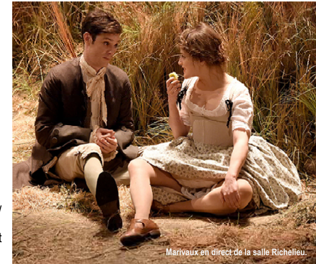
Marivaux en direct de la salle Richelieu.