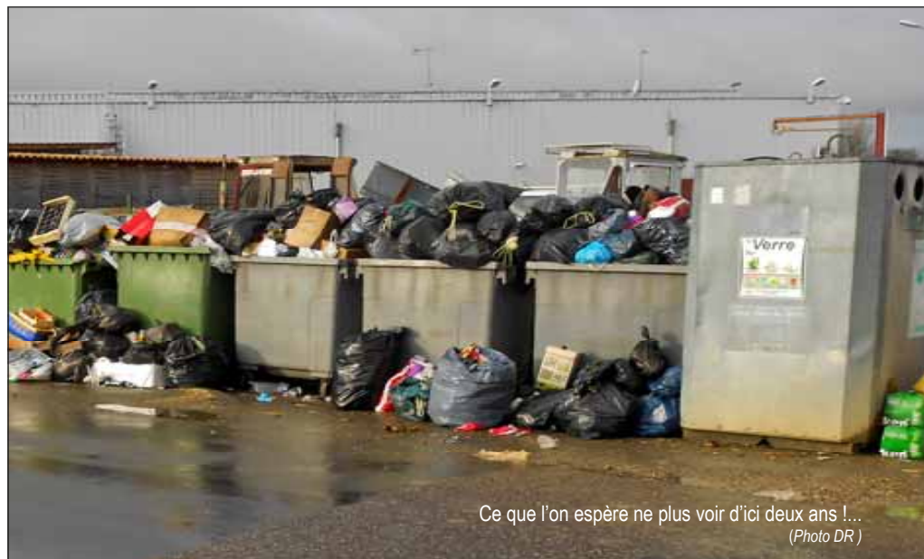
Ce que l'on espère ne plus voir d'ici deux ans !...

La redevance incitative permettra aussi à ceux qui trient et déposent moins de déchets dans les cuves d'avoir une facture moins élevée que ceux qui jetteront tout comme parfois aujourd'hui dans les bacs. ■