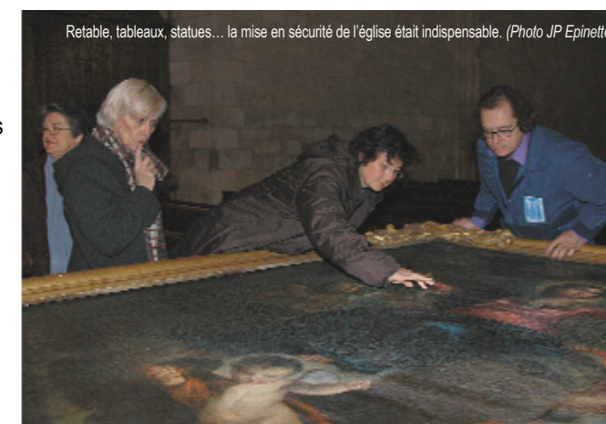
Retable, tableaux, statues... la mise en sécurité de l'église était indispensable.

Le conservateur des Antiquités et des Objets d'Arts de la direction régionale des affaires cultu-