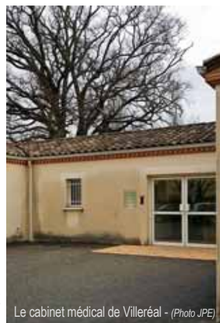
Le cabinet médical de Villeréal

Cette parcelle, d'environ 1 400 m 2 , sera vendue pour l'euro symbolique à la communauté de communes afin qu'elle y construise un bâtiment qui viendra agrandir l'actuel cabinet médical ■