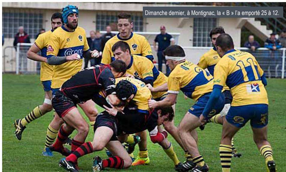
Dimanche dernier, à Montignac, la « B » l'a emporté 25 à 12.

LE CLASSEMENT DE LA "B" : 1 - Ribérac ; 2 - Lalinde ; 3 - Le Lardin ; 4 - Villeréal ; 4 - Vergt ; 6 - Le Passage ; 7 - Mussidan ; 8 - Le Queyran ; 9 - Daglan ; 10 - Port-Ste-Marie ; 11 - Montignac.