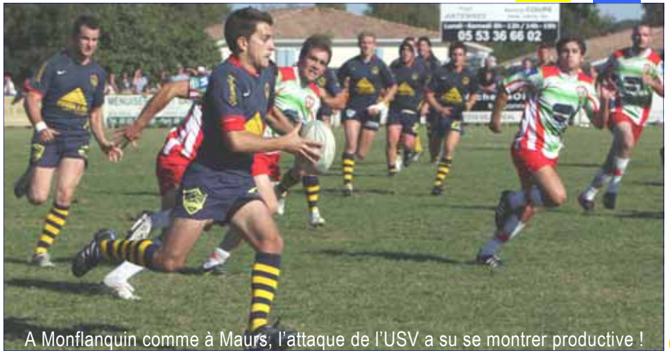
A Monflanquin comme à Maurs, l'attaque de l'USV a su se montrer productive !

Alors, bienvenue à l'équipe de Bretenoux, mais... Allez les Jaune et Bleu !